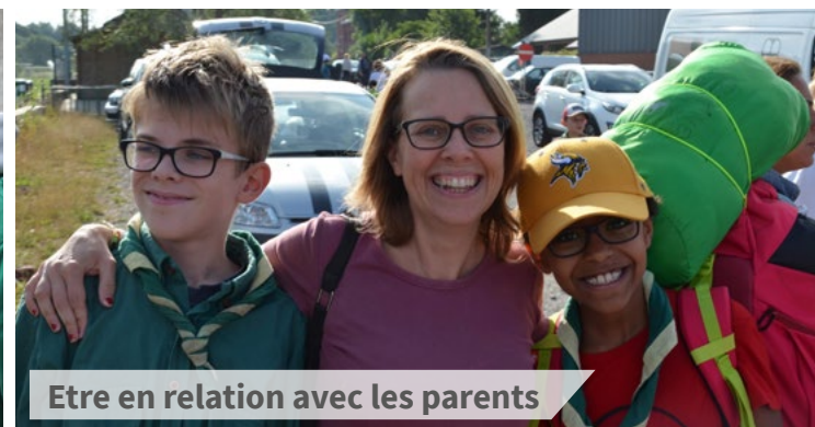
Etre en relation avec les parents