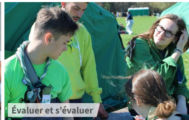
Évaluer et s'évaluer