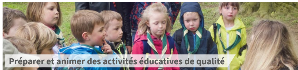
Préparer et animer des activités éducatives de qualité