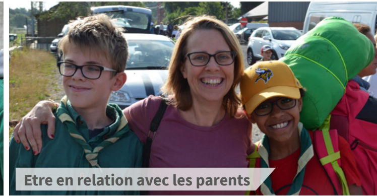
Etre en relation avec les parents