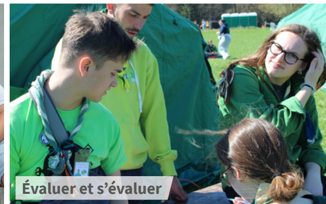
Évaluer et s'évaluer