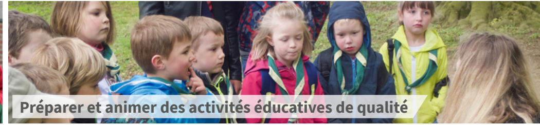
Préparer et animer des activités éducatives de qualité