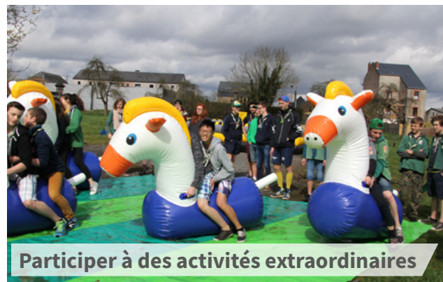
Participer à des activités extraordinaires