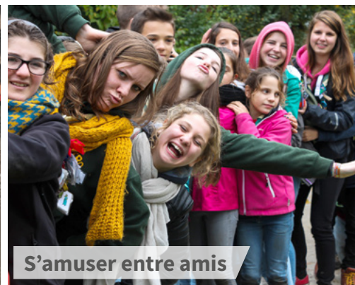
S'amuser entre amis