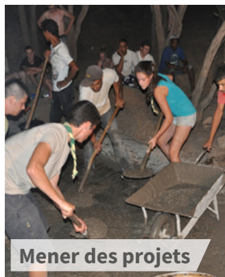
Mener des projets