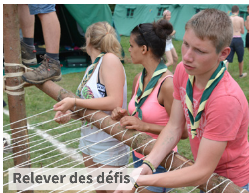
Relever des défis