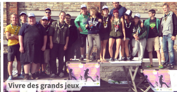
Vivre des grands jeux